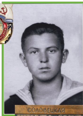
СОЛОВЕЦКАЯ ШКОЛА ЮНГ ВОЕННО-МОРСКОГО ФЛОТА 1942 * 1982